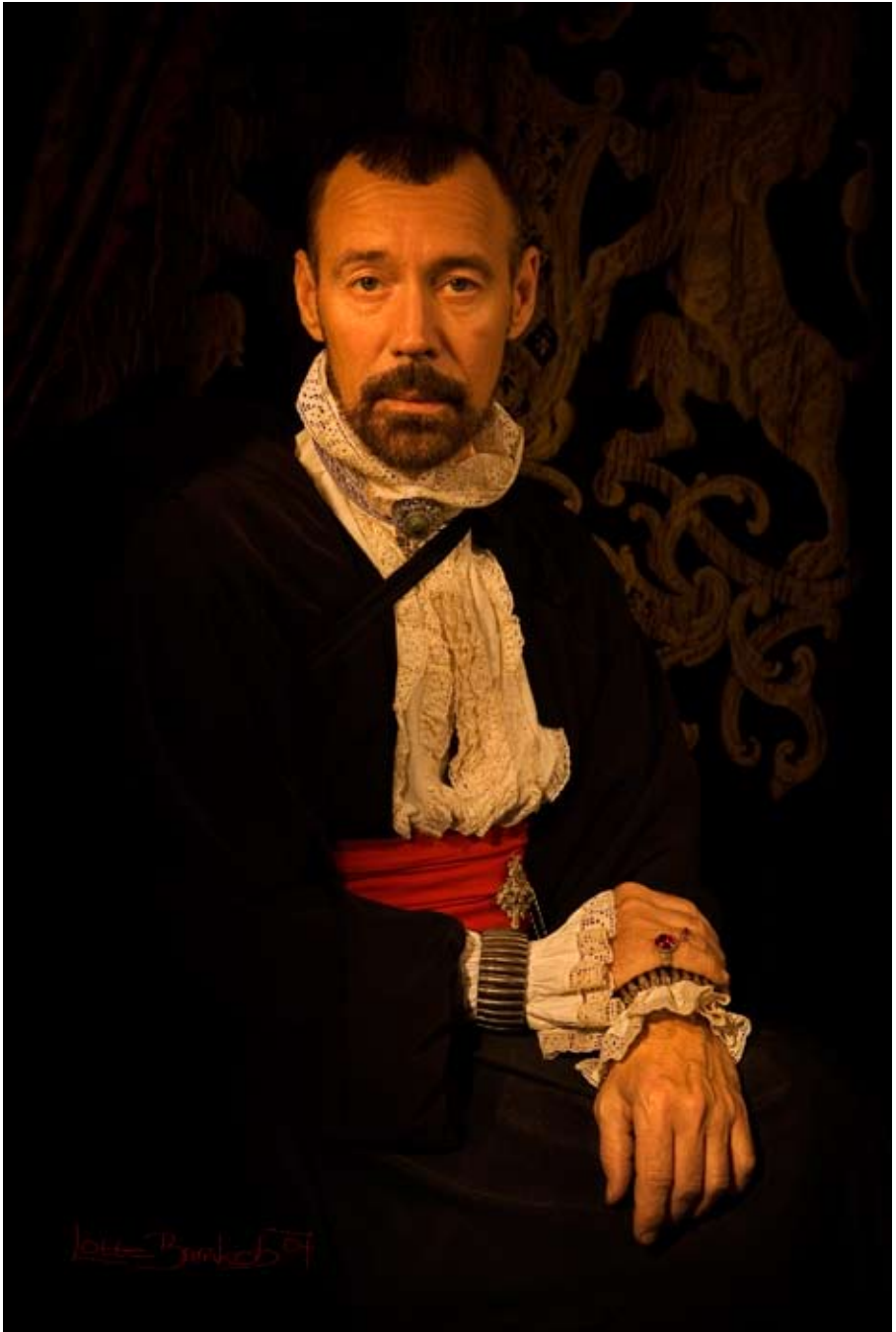
"Drømmen": En parafrase over Rembrandt, ét portræt ud af et samlet værk på fire portrætter. Afgangprojekt og –udstilling ved basiskurset december 2007.